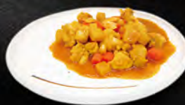
262. POLLO CON MANDORLE € 6,50