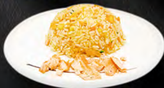
238. SAKE MESHI € 6,50 riso saltato con salmon e verdure