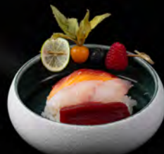
90. CHIRASHI MIX € 8,50 Ciotola di riso con pesce misto