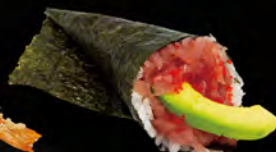
187. TEMAKI SPICY MAGURO € 4,00 Tartare di tonno piccante, tobiko*, avocado, salsa maionese piccante