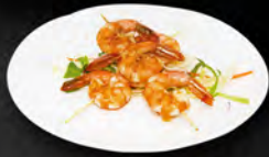
217. EBI TEPPANYAKI 4PZ € 6,50 Spiedini di gamberi* alla piastra in salsa teriyaki