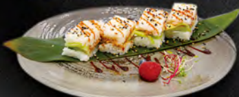
127. OSHIZUSHI MIURA € 7,50 Riso, cetrioli, salmone cotto, philadelphia, salsa teriyaki