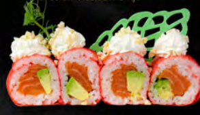
139. SOY SALMONE ROLL € 10,00 Salmone, avocado con philadelphia mandarino all'esterno