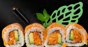
140. PHOENIX ROLL € 11,00 Tartara di salmone piccante, avocado, tobiko*, carpaccio di salmone scottato e salsa teriyaki all'esterno