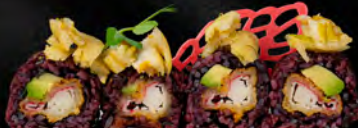
171. BLACK HOLE € 11,00 Riso venere, surimi di granchio* in tempura, carpaccio di salmone e fiori di zucca in tempura all'esterno avocado, salsa teriyaki