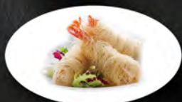
207. GAMBERI D'ORO 5PZ € 10,00 gambero fritto avvolto con fili di patate