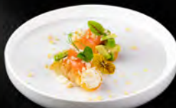
14. TACOS SAKE 3PZ € 7,00 tacos con philadelphia salmone avocado, mandorle