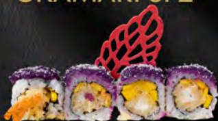
131. KING'S TARO € 10,50 Gambero* in tempura, mango, quarmito con puro di toro, polvere di cocco