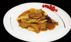
266. MANZO CON FUNGHI E BAMBU € 7,00