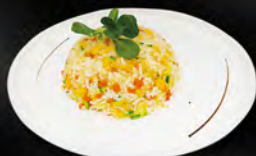
244. YASAI MESHI € 5,50 riso saltato con uova e verdure