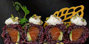
167. BLACK NISHINO MAKI € 9,00 riso venere, salmone, avocado philadelphia, granella di pistacchio all'esterno, salsa teriyaki