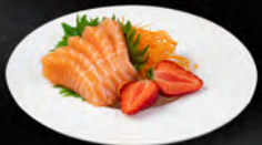
91. SASHIMI SAKE 7PZ € 7,50 Sashimi di salmone