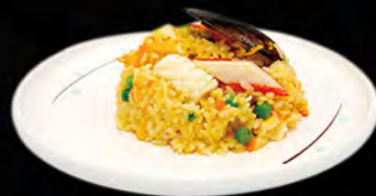
240. KAISEN MESHI € 7,50 riso saltato con frutti di mare uova e verdure