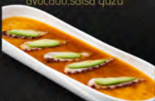
99. CARPACCIO TAKO 7PZ € 8,50 polipo*, sesamo, avocado, salsa yuzu