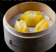
38. TARA GYOZA* 4PZ € 6,50 Ravioli di merluzzo al vapore