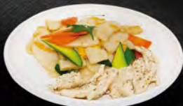
237. GNOCCHI CHICKEN € 6,50

Gnocchi di riso saltati con gamberi*, uova e verdure