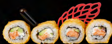
157. FRITTO ROLL € 9,00

Sunimi* con maionese avocado,quarnito con tobiko*