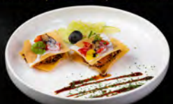
19. TRUFFLE SAKE 3PZ € 7,00 sfoglia croccante salmone, tartufo nero crema panna