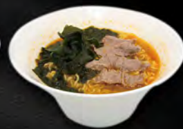
273. RAMEN BRODO CON MANZO E VERDURA € 8,00