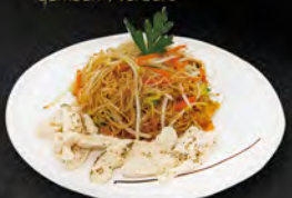
233. YAKI FEN CHICKEN € 6,00

Spaghetti di riso saltati con gamberi*,uova, verdure