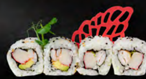
142. URA SUMO € 8,00 Surimi*, avocado, gambero* colto