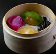
41. GYOZA MIX* 4PZ € 6,50 Ravioli misti al vapore