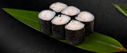
118. HOSO EBI 6PZ € 4,00 gambero colto