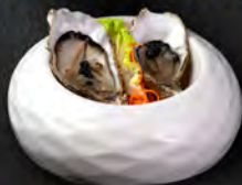
● 01. OSTRICHE 2PZ € 9,00