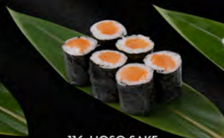
116. HOSO SAKE 6PZ € 4,00 salmone