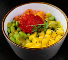
84. POKE SAKE € 8,50 poke con riso bianco, salmone, avocado, mango, edamame, goma wakame, sesamo, salsa di mango.