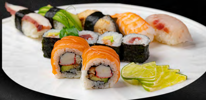
203. SUSHI MIX* € 10,50 4pz hosomaki, 5pz nigiri, 2pz uramaki