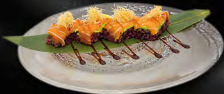
130. OSHIZUSHI PHILA € 7,50 Riso venere, salmone, philadelphia, avocado, pasta kataifi, salsa di teriyaki