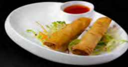
23. INVOLTINI PRIMAVERA 3PZ € 3,50 croccante sfoglia di farina di grano con ripieno di verdure