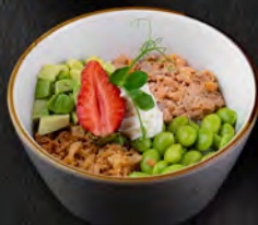
83. POKE MIURA € 8,50 poke con riso bianco, salmone cotto, cipolla fritta, philladelphia, avocado, edamame.