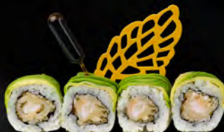
132. DRAGON ROLL € 11,00 Gambero* in tempura, maionese, avocado all'esterno, salsa teriyaki