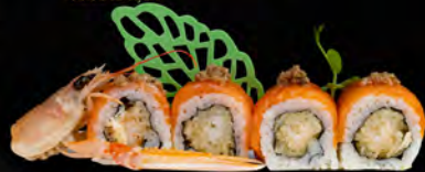
160. SCAMPI ROLL € 12,00

insalata, avocado, cetrioli,quarnito con carpaccio di vitello scottato, salsa teriyaki.