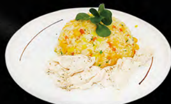
243. CHICKEN MESHI € 6,50 riso saltato con pollo, uova e verdure