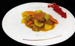
265. MANZO AL CURRY € 7,00