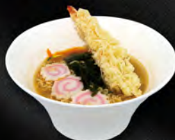
270. RAMEN BRODO CON GAMBERO* TEMPURA € 7,00