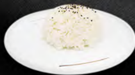
245. WHITE MESHI € 2,50 riso bianco al vapore con sesamo