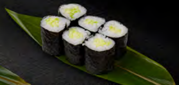
120. HOSO KAPPA 6PZ € 4,00 cetriolo