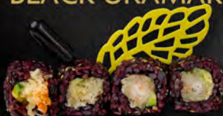
161. BLACK EBI € 9,50

Gambero* in tempura, avocado, maionese e salsa teriyaki