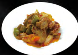
268. ANATRA IN SALSA PICCANTE € 7,00