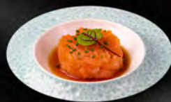
24. TARTARE SAKE € 8,00 salmone, sesamo, erba cipollina, salsa ponzu