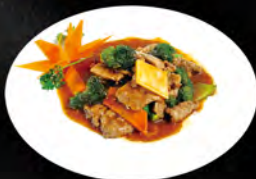
249. MANZO PEPE NERO € 7,00