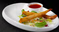
22. SAMURAI STICK 3PZ € 5,00 involtini di gamberi*