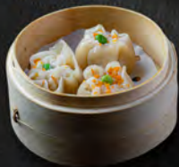
31. EBI SHUMAI* 4PZ € 4,00 ravioli di carne di maiale e gamberi al vapore con carote piselli