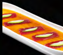
97. CARPACCIO MAGURO 7PZ € 8,50 tonno, sesamo, avocado, salsa yuzu