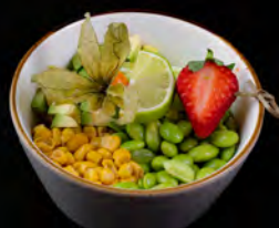
86. POKE VEGE € 7,50 poke con riso bianco, avocado, mais, cetrioli, edamame