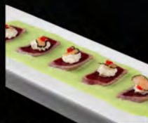
112. TATAKI KING'S TUNA 7PZ € 11,50 Fette di tonno scottato con salsa basilico e menta, philadelphia tartufo nero,tobikko