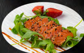
110. TATAKI SAKE 7PZ € 9,50 Fette di salmone scottato con e salsa teriyaki