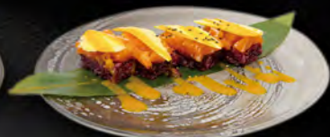
129. OSHIZUSHI MANGO € 7,50 Riso venere, spicy salmone, mango e salsa di mango