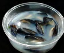
45. ZUPPA DI COZZE € 6,50