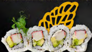
137. URAMAKI CALIFORNIA € 8,00 Surimi di granchio*, cetriolo, maionese, avocado