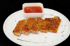
214. TONKATSU € 7,00 cotoletta di maiale impanata fritto