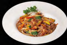
227. YAKI SOIA VEGE € 5,50