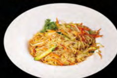
231. YAKI FEN VEGE € 5,50

Spaghetti di soia saltati con maiale, peperoni, cipolla, salsa piccante