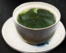
42. ZUPPA DI MISO € 4,00 alghe, tofu, cipollino