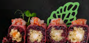
173. PINKO ROLL € 14,00 farcito con gamberi fritti, avvolto con sfoglia di tofu guarnito con tartar di gamberoni crudi