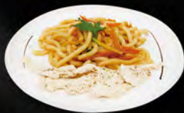
225. YAKI UDON CHICKEN € 7,00

Pasta udon saltata con gamberi*, uova, verdure