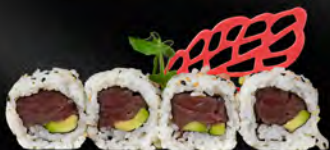
152. URAMAKI MAGURO € 8,00