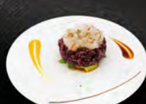
26. TARTARE*BLACK SAKURA € 9,00 avocado riso venere gamberi* crudo, salsa speciale