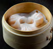
32. EBI CRYSTAL* 4PZ € 6,00 ravioli di gamberi in cristallo al vapore