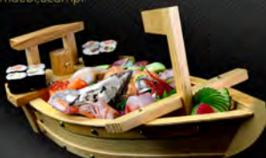
● 205. BARCA PICCOLA* 37PZ € 35,00 1 ostrica, 1 gambero rosso, 1 scampo 8 sashimi, 8 nigiri, 8 uramaki, 8 hosomaki, 2 gunkan