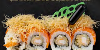
134. TIGER ROLL € 10,00 Gambero* in tempura, maionese, carpaccio di salmone all'esterno, pasta kataifi, salsa teriyaki