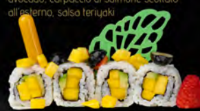
136. FRUTTI MIX ROLL € 10,00 Mango avocado con mango fragolla all'esterno, salsa mango