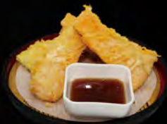
210. YASAI TEMPURA € 7,00 tempura di verdure miste