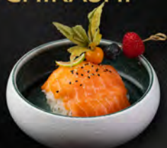
87. CHIRASHI SAKE € 7,50 Ciotola di riso con salmone