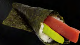
181. TEMAKI MAGURO € 4,50 Tonno, avocado