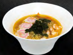
271. RAMEN BRODO CON GAMBERI*COTTI E VERDURA € 8,00