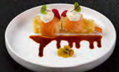
17. EBI DYNAMITE 3PZ € 7,00 bocconcini di tempura di gamberi* avvolti con carpaccio di salmone scottato e guarniti con philadelphia e salsa teriyaki