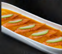
95. CARPACCIO SAKE 7PZ € 7,50 salmone, sesamo, avocado, salsa yuzu