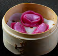
40. GYUNIKU GYOZA* 4PZ € 6,50 Ravioli di vitello al vapore