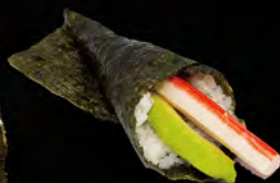
183. TEMAKI KANI € 4,00 Sunimi di granchio*, avocado