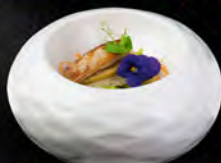
● 02. FOIE GRAS € 12,00 foie gras, pane mele