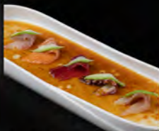
96. CARPACCIO MIX 7PZ € 8,50 pesce misto, sesamo, avocado, salsa yuzu