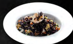
247. BLACK RISO € 7,50 riso venere saltato con frutti di mare e verdure misti