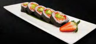
179. FUTO MIX 5PZ € 6,00 cetriolo, salmone, insalata, avocado e tobiko*