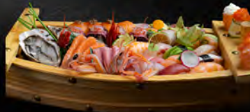
● 206. BARCA MEDIA* 57PZ € 55,00 2 ostriche, 2 gamberi rossi, 2scampi 15 sashimi, 8 nigiri, 16 uramaki, 8 hosomaki, 4 gunkan,