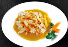
248. POLLO IN SALSA SESAMO € 7,00