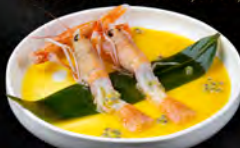
● 07. SCAMPI FRUIT 3PZ € 9,00 scampi con salsa passion fruit