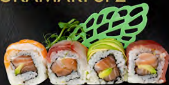
143. ARCOBALENO € 10,00

Salmon, avocado, maionese, carpaccio di pesce misto* all'esterno