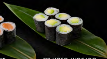
117. HOSO AVOCADO 6PZ € 4,00 avocado