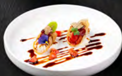
13. TACOS TUNA 3PZ € 7,00 tacos con philadelphia, tonno, pomodoro tartufo nero, salsa teriyaki