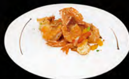
251. GAMBERI* AL SALE E PEPE € 7,00