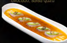
101. KAMAICHI IN PRIMAVERA 7PZ € 9,50 carpaccio di ricciola in salsa yuzu con avocado tartufo nero