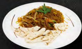
228. YAKI SOIA CHICKEN € 7,00

Spaghetti di soia saltati con pollo, verdure