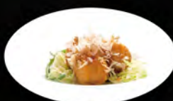
209. TAKOYAKI 4PZ € 6,50 polpette di polpo fritto in versione giapponese