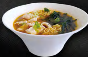
272. RAMEN BRODO CON POLLO E VERDURA € 8,00