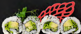
146. URAMAKI YASAI € 7,00

Gamberoni* in tempura, avocado, philadelphia con tartare di branzino, olio di tartufo, pepe nero all'esterno, salsa teriyaki