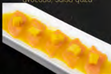
103. CARPACCIO SAKE MANGO 7PZ € 9,50 carpaccio di salmone, mango, salsa di mango