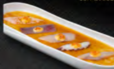
104. CARPACCIO FLABE MIX 7PZ € 9,50 carpaccio di pesce mix flabe, con salsa piccante, salsa yuzu