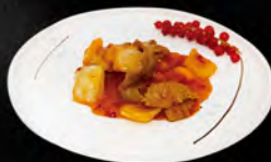
264. MANZO IN SALSA PICCANTE € 7,00