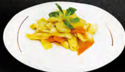
261. POLLO AL CURRY € 6,50