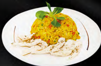
242. CURRY MESHI € 6,50 riso saltato con pollo, uova, verdure e curry