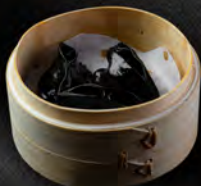
39. IKA GYOZA* 4PZ € 6,50 Ravioli di calamaro al vapore