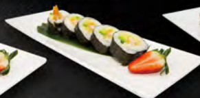
175. FUTO EBI 5PZ € 6,00 gambero* in tempura, avocado maionese, salsa teriyaki