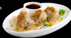
34. GRILLED GYOZA* 4PZ € 4,50 ravioli di carne di maiale alla griglia