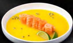
106. CARPACCIO K SAKE 7PZ € 8,50 *salsa al mango e frutta della passione