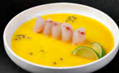
107. CARPACCIO K SUZUKI 7PZ € 8,50 carpaccio di branzino con *salsa al mango e frutta della passione