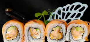
147. KUNSEI € 11,00

Salmon in tempura con avocado, philadelphia e salmone affumicato all'esterno, salsa teriyaki