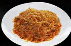
230. YAKI SOIA SPICY € 7,00

Spaghetti di soia saltati con gamberi*, verdure