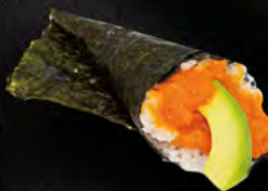
185. TEMAKI SPICY SAKE € 4,00 Tartare di salmone piccante, tobiko*, avocado, salsa maionese piccante