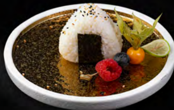
199. ONIGIRI EBI € 3,50 Gamberi* cotti e maionese