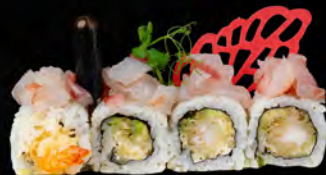
145. KILL ROLL € 12,00

Gambero* in tempura, avocado, philadelphia, con tartare di salmone, mandorla all'esterno, salsa teriyaki