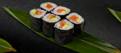
119. HOSO SAMO 6PZ € 4,50 salmone,avocado