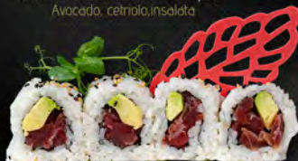
149. URAMAKI SPICY MAGURO € 8,50

Tartare di salmone piccante, tobiko*, avocado, salsa maionese pip