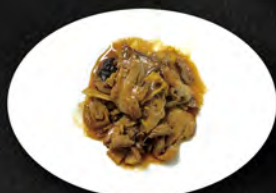
267. ANATRA BAMBU FUNGHI € 7,00