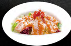
55. INSALATA TATAKI SAKE € 7,50 insalata ricoperta* con fettine di salmone scottato con salsa maie