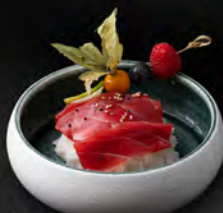
88. CHIRASHI MAGURO € 8,50 Ciotola di riso con tonno