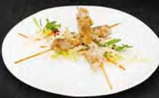
216. TORI TEPPANYAKI 4PZ € 6,00 Spiedini di pollo alla piastra in salsa teriyaki