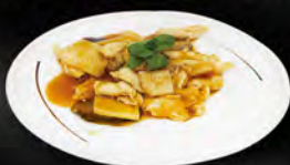
260. POLLO CON FUNGHI BAMBU € 6,50