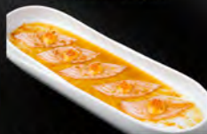
100. CARPACCIO FLABE SAKE 7PZ € 8,50 carpaccio di sake flabe, con salsa piccante, salsa yuzu