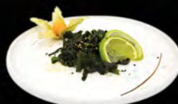
49. WAKAME SALDAD € 4,00 insalata di alghe con salsa ponzu