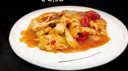
259. POLLO IN SALSA PICCANTE € 6,50