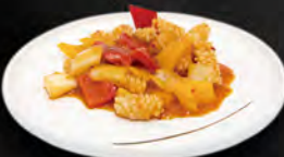
256. CALAMARI* IN SALSA PICCANTE € 6,50