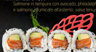
150. URAMAKI PHILADELPHIA € 8,00

Tartare di tonno piccante, tobiko*, avocado, salsa maionese piccante