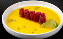
108. CARPACCIO K TUNA 7PZ € 8,50 carpaccio di tonno con *salsa al mango e frutta della passione