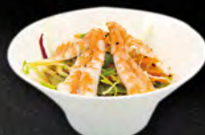
52. EBI SALAD € 6,50 insalata mista con gamberi* cotti con salsa maie