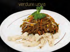
235. YAKI SOBA CHICKEN € 6,50

Spaghetti di grano saraceno saltati con gamberi*,uova, verdure