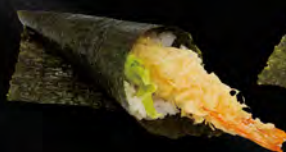
186. TEMAKI TEMPURA € 4,00 Gambero* in tempura, insalata, maionese, salsa teriyaki