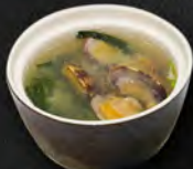
46. ZUPPA DI PESCE € 4,50 mista di pesce, alghe