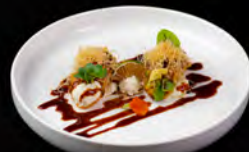
16. TACOS MIURA 3PZ € 7,00 tacos con philadelphia salmone cotto avocado, pasta kataifi, teriyaki