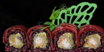
169. BLACK QUEEN € 10,00 Riso venere, gambero* in tempura, maionese, carpaccio di tonno scottato all'esterno, salsa teriyaki