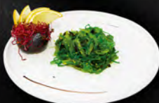
47. GOMA WAKAME € 4,00 insalata di alghe leggermente piccanti con sesamo