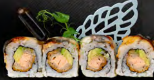
141. UNAGI ROLL € 12,00 Salmone in tempura, avocado, anquilla* grigliata all'esterno, salsa teriyaki