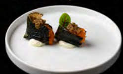
20. CRISPY BLACK 3PZ € 7,00 sfoglia di alghe nori, salmone marinato teriyaki, tartufo nero, jalapeno