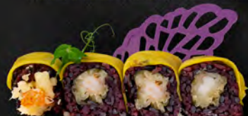
170. BLACK EBI MANGO € 11,00 riso venere, tempura, philadelphia, guarnito con mango e salsa mango