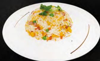
241. RISO CONTONESE € 5,50 riso saltato con prosciutto mais, uova e piselli