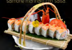
● 12. ASTICE ROLL € 15,00 ostice e gambero al vapore tritato maionese, asparagi, quarnero con salmone e limes