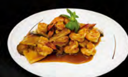
255. GAMBERI* CON FUNGHI BAMBU € 6,50