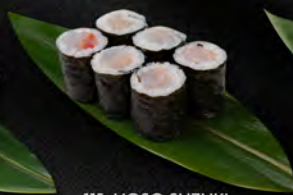
115. HOSO SUZUKI 6PZ € 4,50 branzino