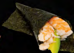
182. TEMAKI EBI € 4,00 Gambero cotto*, avocado