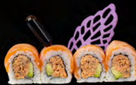
133. SUNRISE ROLL € 11,00 Salmone grigliato condito con philadelphia, avocado, carpaccio di salmone scottato all'esterno, salsa teriyaki