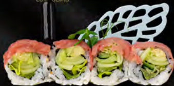
159. ROLL BEEF € 9,50

Salmonc avocado maionese con mango all'esterno salsa teriyaki