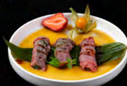
● 03. INVOLTINI BEEF 3PZ € 12,00 involtini di manzo scottato con ripiro di wakame, tartufo nero in salsa teriyaki e yuzu