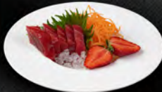
92. SASHIMI MAGURO 7PZ € 7,50 Sashimi di tonno