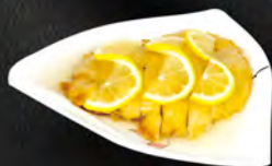
263. POLLO LIMONE € 6,50