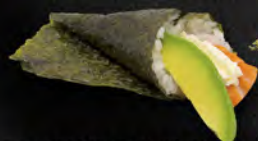
188. TEMAKI PHILADELPHIA € 4,00 Salmone, avocado, philadelphia