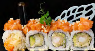
144. FULL TEMPURA € 12,00

Salmon, avocado, maionese, carpaccio di pesce misto* all'esterno