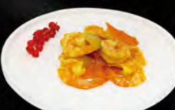
254. GAMBERI* AL CURRY € 6,50