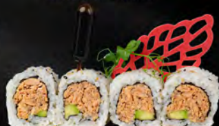
154. URAMAKI MIURA € 8,00

Salmon, gnigliato condito con avocado, philadelphia, salsa teriyaki