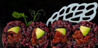
168. BLACK LAVA LAND € 9,00 riso venere, tartare di tonno piccante avocado, tobiko* salsa maionese piccante