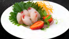
93. SASHIMI SUZUKI 7PZ € 7,50 Sashimi di branzino