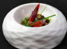
● 05. TARTARE AMAEBI € 11,00 tartare di gamberi rosso, wakame, salsa di tartufo nero, salsa yuzu