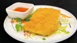
215. CHICKEN FURAI € 7,00 cotoletta di pollo impanato fritto