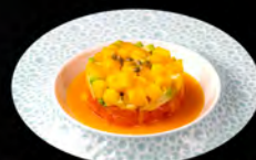
30. TARTARE MANGO € 10,00 avocado, salmone, mango e salsa di mango