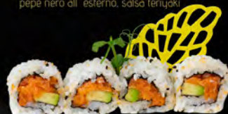
148. URAMAKI SPICY SAKE € 7,50

Salmon in tempura con avocado, philadelphia e salmone affumicato all'esterno, salsa teriyaki