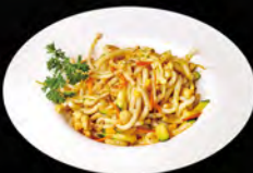
226. YAKI UDON VEGE € 5,50

Pasta udon saltata con pollo, uova, verdure