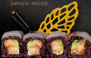
165. BLACK AND WHITE € 10,00

Riso venere, salmone in tempura, philadelphia, carpaccio di branzino all'esterno, salsa teriyaki