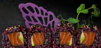
162. BLACK SAKE € 9,00

Gambero* in tempura, avocado, maionese e salsa teriyaki