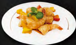
252. GAMBERI*IN SALSA AGRODOLCE € 7,00