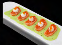
113. TATAKI KING'S SAKE 7PZ € 11,50 Fette di salmone scottato con salsa basilico e menta, philadelphia ikura.