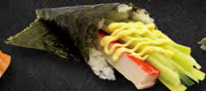
189. TEMAKI CALIFORNIA € 4,00 Sunimi di granchio*, cetriolo, maionese