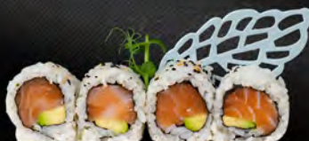
153. URAMAKI SAKE € 7,00