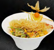
54. GAMBERI SALAD € 7,50 insalata mista con gambero* in tempura con salsa maie