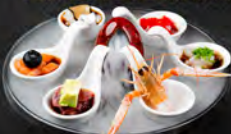
● 10. KING`S TARTARE MIX € 15,00 Degustazione di tartare di ricciola, gambero rosso, tonno, salmone, amaebi, scampi.