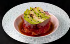
28. TARTARE MIX € 9,00 salmone, tonno, branzino, sesamo erba cipollina, avocado salsa ponzu