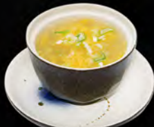
44. ZUPPA DI MAIS € 4,50 pollo, uova, mais