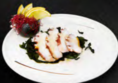
50. WAKAME TAKO € 5,50 insalata di alghe con polipo* e salsa ponzu