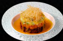
29. TARTARE BLACK € 10,00 tartare di salmone e riso venere ricoperto con avocado, pasta kataifi salsa al mango