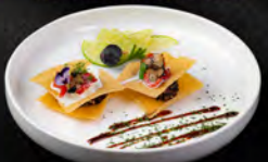
18. TRUFFLE TUNA 3PZ € 7,00 sfoglia croccante tonno tartufo nero crema panna