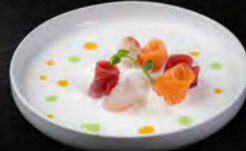
109. CARPACCIO ARCOBALENO 7PZ € 9,50 carpaccio mix con crema, mozzarella,