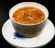
43. ZUPPA AGRO-PICCANTE € 4,50 uova, tofu, pollo, verdure