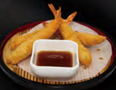
212. EBI NIDO 5PZ € 9,00 gamberi*avvolti in pasta bank