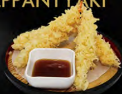
208. EBI TEMPURA 5PZ € 10,00 tempura di gamberi