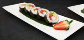
174. FUTO HIKARU 5PZ € 6,50 tonno, salmone, surimi* e avocado