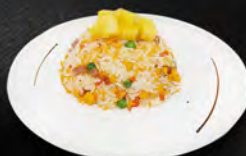
246. TAI MESHI € 6,50 riso saltato con ananas, verdure, uova