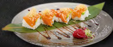
128. OSHIZUSHI SAKE € 7,50 Riso, carpaccio di salmone, avocado, pasta kataifi, salsa teriyaki