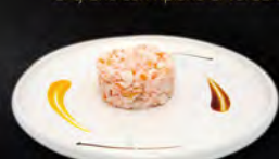
27. TARTARE GAMBERI € 9,00 gamberi* cotti e salsa di sesamo