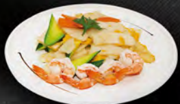
236. GNOCCHI EBI € 6,50

Spaghetti di grano saraceno con pollo, uova, verdure