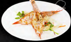
218. EBI NO SHIOYAKI 4PZ € 7,00 Gamberoni* alla piastra in salsa teriyaki