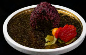
201. VENERE ONIGIRI SAKE € 3,50 salmone spicy