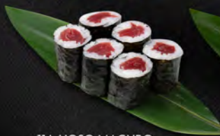
114. HOSO MAGURO 6PZ € 4,50 tonno