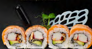
138. FUJI WHITE € 12,00 Anquilla*, surimi di granchio*, avocado, carpaccio di salmone scottato all'esterno, tobiko*, salsa teriyaki