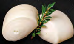
35. PANE BIANCO 3PZ € 3,00 pane bianco al vapore