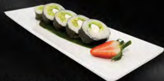
177. FUTO YASAI 5PZ € 6,00 avocado, cetriolo, lattuga e philadelphia