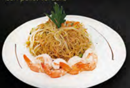
232. YAKI FEN EBI € 6,00

Spaghetti di riso saltati con verdure,uova