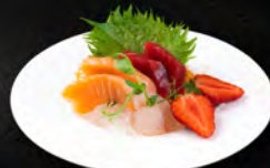
94. SASHIMI MIX 7PZ € 7,50 Sashimi misto