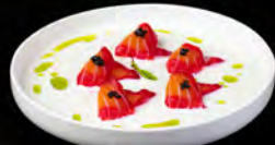
● 08. SALMONE KING`S € 10,00 salmone marinato con salsa,