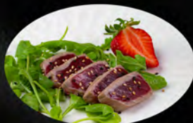
111. TATAKI MAGURO 7PZ € 10,50 fetti di tonno scottato con sesamo e salsa teriyaki