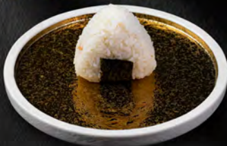
197. ONIGIRI MIURA € 3,50 Salmone cotto, philadelphia