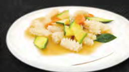
257. CALAMARI* CON VERDURE MISTE € 6,50