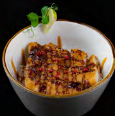
85. SAKANA CHICKEN HOMAKASE € 7,50 pollo in tempura, salsa teriyaki