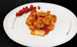
253. GAMBERI* IN SALSA PICCANTE € 7,00