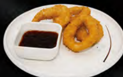
213. TEMPURA IKA € 8,50 anelli di calamari* fritti