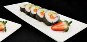
176. FUTO KREI 5PZ € 6,00 salmone, avocado e surimi*