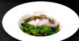
● 11. CAPESANTE HOKKAIDO € 11,00 capesante di hokkaido, con crema di tartufo, wakame, salsa king` s