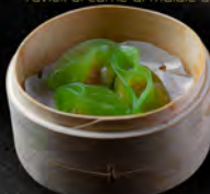
37. ERAVIOLI VERDI* 4PZ € 6,50 ripieno di verdure