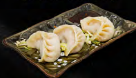
33. GYOZA* 4PZ € 4,00 ravioli di carne di maiale al vapore