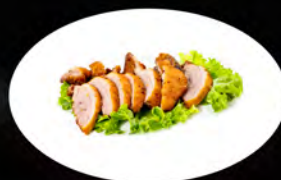
269. ANATRA CROCCANTE € 7,00