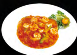
250. GAMBERI AGROPICCANTE € 7,00