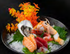
● 06. SASHIMI SPECIALE KINGS € 15,00 1 gamberi rosso, 1 scampi, 1 ostriche, 3 salmone, 3 branzino, 3 tonno,