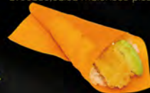
191. TEMAKI CHICKEN € 4,00 TemaKi con alga di soia colorata, pollo in tempura, avocado maionese