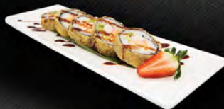
178. FUTO MEX 5PZ € 7,00 salmone, avocado, philadelphia surimi* fritto con teriyaki