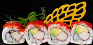
156. URAMAKI TOBIKO € 9,00

Gambero* in tempura maionese pasta kataifi, salsa teriyaki