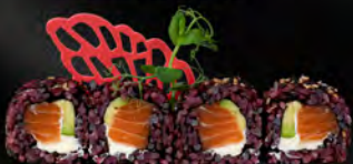
164. BLACK SAKE PHILA € 9,00

Riso venere, tartare di salmone piccante, avocado, tobiko, salsa maionese piccante