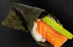
180. TEMAKI SAKE € 4,00 Salmone, avocado