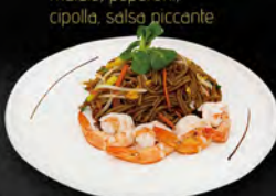
234. YAKI SOBA EBI € 6,50

Spaghetti di riso saltati con pollo, uova, verdure