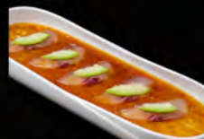
98. CARPACCIO SUZUKI 7PZ € 8,50 branzino, sesamo, avocado, salsa yuzu