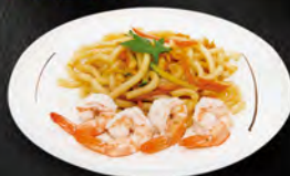
224. YAKI UDON EBI € 7,00

Pasta udon saltata con gamberi*, uova, verdure