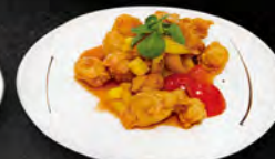
258. POLLO IN SALSA AGRODOLCE € 6,50