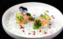
15. TACOS EBI 3PZ € 7,00 tacos con gamberi cotti philadelphia maionese prezzemolo cipolla, avocado tobiko