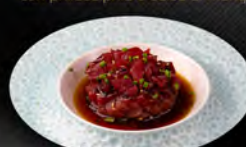
25. TARTARE MAGURO € 9,00 tonno, sesamo, erba cipollina, salsa ponzu