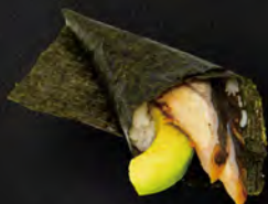
184. TEMAKI UNAGI € 4,50 Anguilla*, avocado