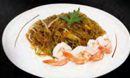
229. YAKI SOIA EBI € 7,00

Spaghetti di soia saltati con pollo, verdure