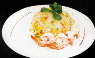
239. EBI MESHI € 6,50 riso saltato con gamberi* uova e verdure