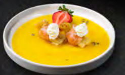
21. HANA SAKE 3PZ € 7,00 bocconcini di tempura di fiori di zucca avvolti con carpaccio di salmone scottato e guarniti con philadelphia e salsa al mango