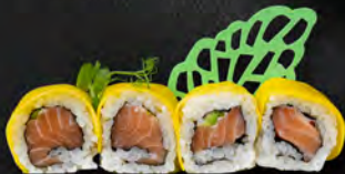
158. MANGO ROLL € 9,50

Salmonc, avocado, philadelphia e salsa teriyaki