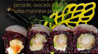
166. BLACK SUZUKI € 10,00

Riso venere, salmone in tempura, philadelphia, carpaccio di branzino all'esterno, salsa teriyaki