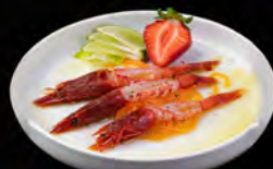
● 04. GAMBERI ROSSO 3PZ € 11,00 gamberi rosso con olio olive, pepe nero