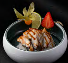
89. CHIRASHI UNAGI € 11,50 Ciotola di riso con anquilla* e salsa teriyaki